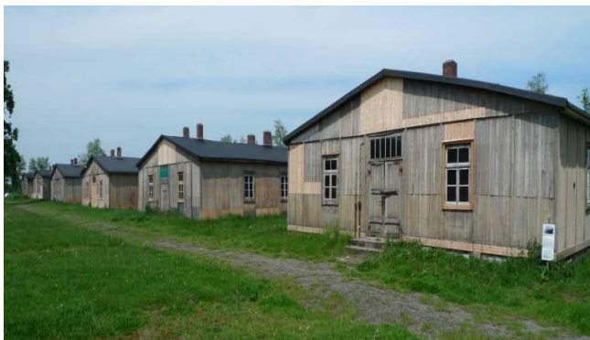
Gesamtansicht der ehemaligen Unterkunftsbaracken, 21.5.2012

Die Frage nach dem farblichen Äußeren seit der Erschaffung der Objekte und die Art der Instandsetzung von Bau-, Kunst- und archäologischen Denkmälern ist von großer Bedeutung: Wird eine ursprüngliche Farbfassung wiederhergestellt? Welche farbliche Gestaltung entspricht unseren heutigen Sehgewohnheiten, welche denen der Erschaffungszeit oder der heute erhaltenen Ausstattung? Diese und andere Fragen sollen am Tag des offenen Denkmals anhand von ausgewählten Beispielen für die Gedenkstätte Lager Sandbostel beantwortet werden.