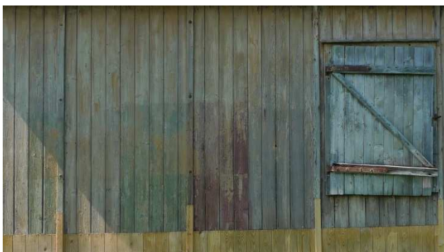
Farbschichten an einer ehemaligen Unterkunftsbaracke, 2.5.2012

Gedenkstätte Lager Sandbostel Grefstr. 3, 27446 Sandbostel bei Bremervörde Tel: 04764-2254810 E-Mail: Info@stiftung-lager-sandbostel.de